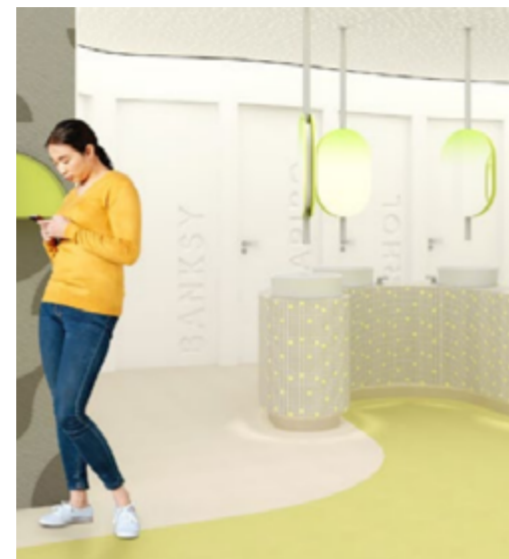
Sanitäräume in Schulen